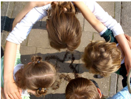
Religiöse Kinderwoche 2009