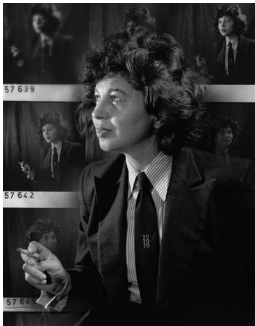
Portraitserie Mascha Kaléko, 1956.05.22, Thelem Universitätsverlag

Mascha Kaléko spiegelt in Gedichten auch das Altern, die Vergänglichkeit, die melancholische Reflexion über